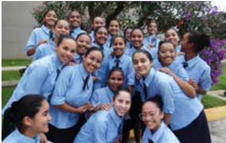
Die Mädchen in Brasilien sind dankbar, dass sie bei den Schwestern Maria Zukunft und Hoffnung finden.

Danke, dass Sie als unsere lieben Wohltäter dies ermöglichen. An dieser Stelle möchten wir auch insbesondere unseren Freunden danken, die uns nach ihrem Leben mit einer Gabe bedenken. Vergelt's Gott.